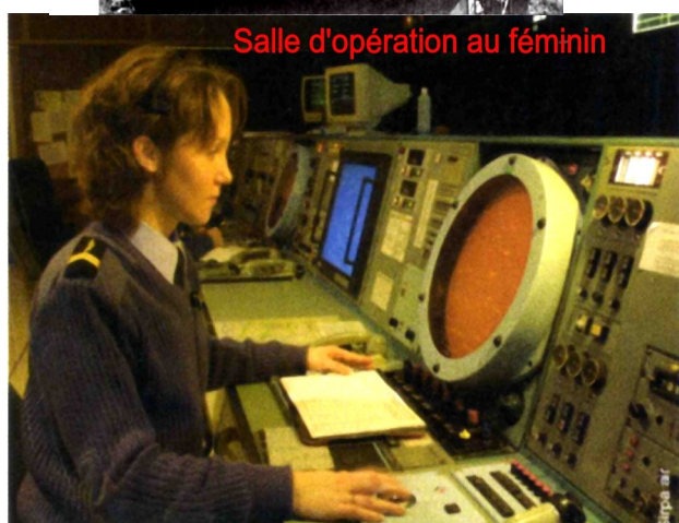
Salle d'opération au féminin

Depuis l'autoroute et partout ailleurs autour de Bulgnéville, on peut apercevoir le radôme du radar ARES, qui est toujours fonctionnel.