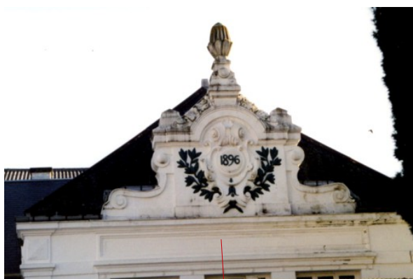
Le fronton de la salle à manger de l'hôtel de la Providence (restaurant du casino en 1990)

H- l'hôtel de la Providence a changé de look