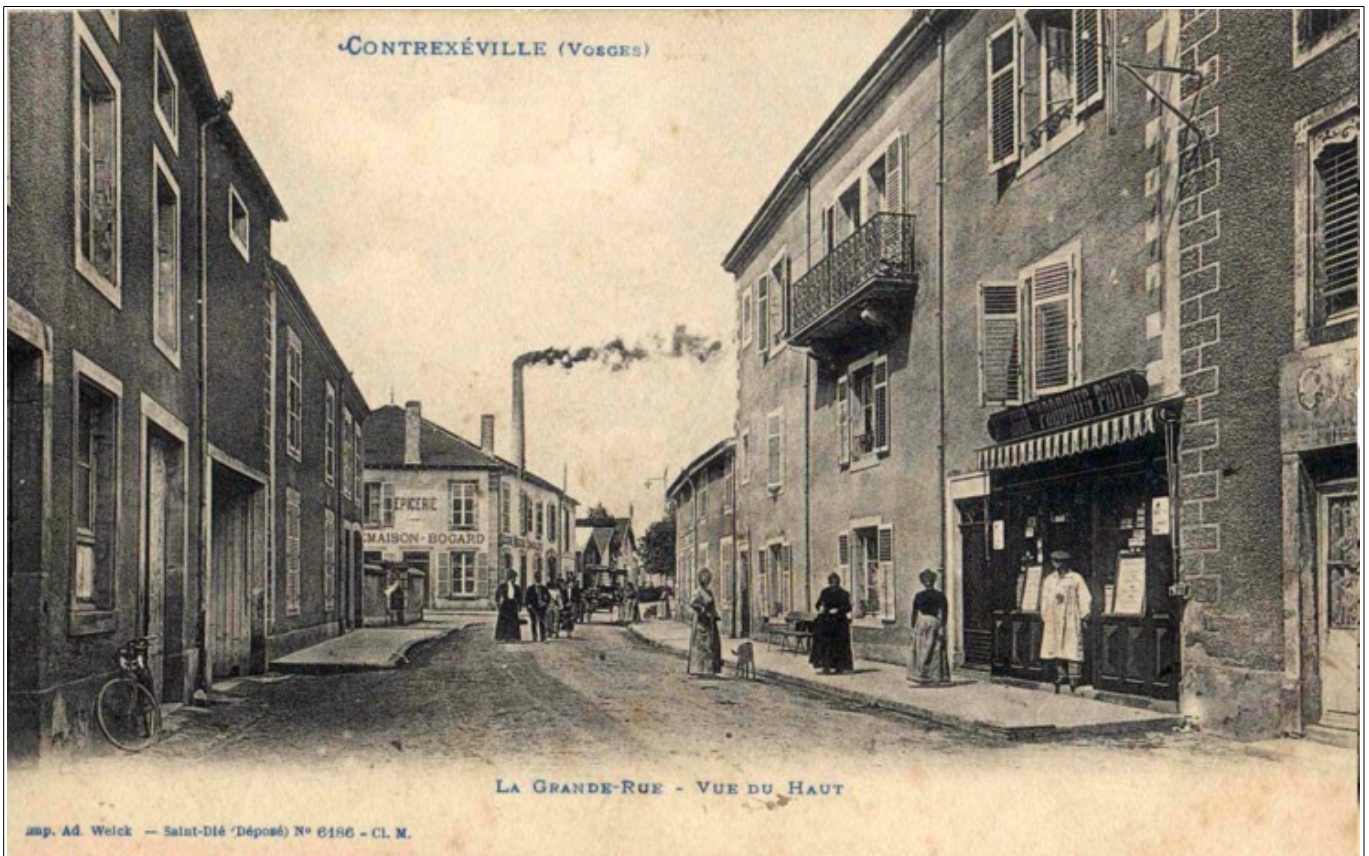
Une rue animée avec en toile de fond la fumée de l'usine d'électricité