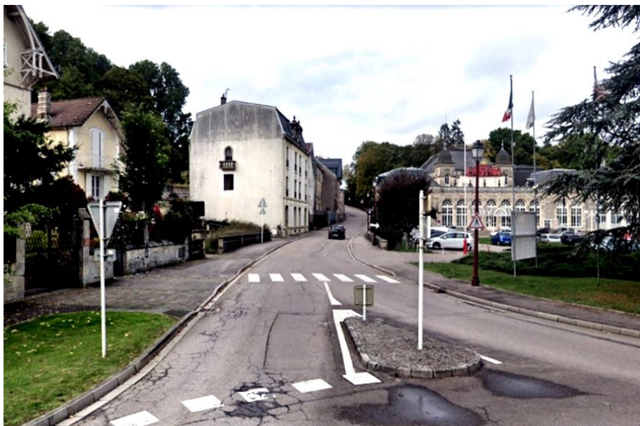
Rue général Hirschauer aujourd'hui