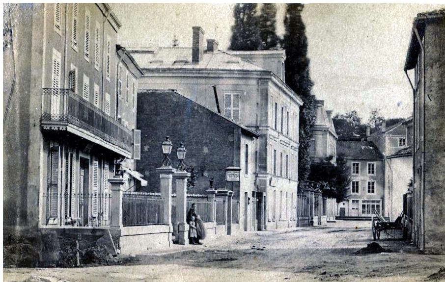
Avant 1880, une rue du centre de Contrexéville appelée « rue du Pont Rouge »