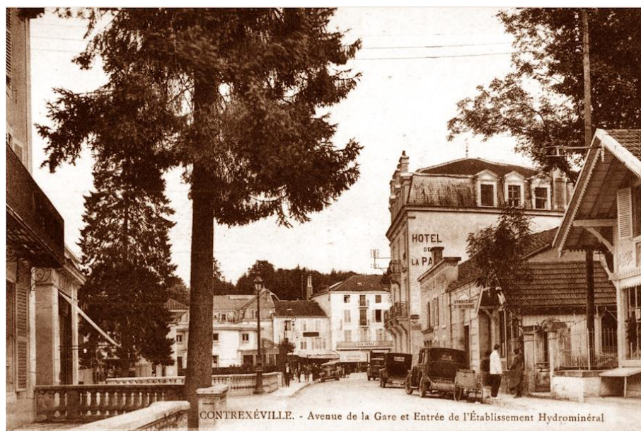
La même rue devenue « rue de la Gare » après 1880