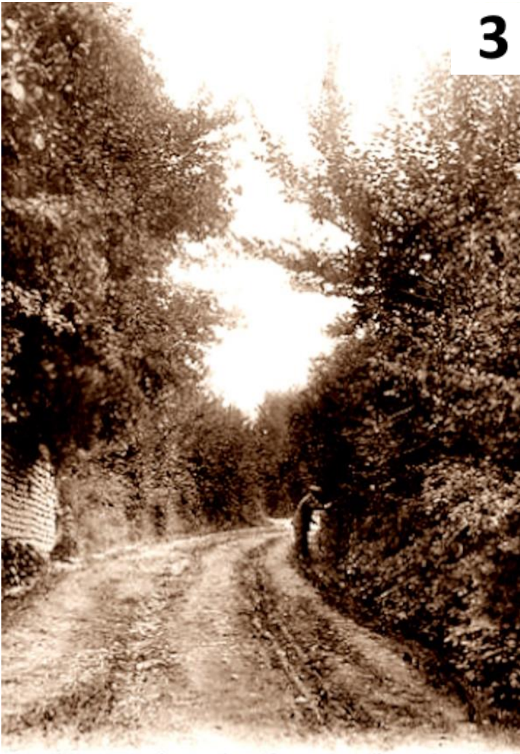
21. CONTREXÉVILLE-pittoresque — Un coin rustique

Ce chemin rustique et l'ancien chemin médiéval qui rejoignait le bois du Hazau, forêt communale de Contrexéville. À ce niveau ou sera édifié la chapelle de la Délivrance en 1945, il y a l'embranchement d'un chemin se dirigeant à droite vers Vittel en contournant le bois du hazau.