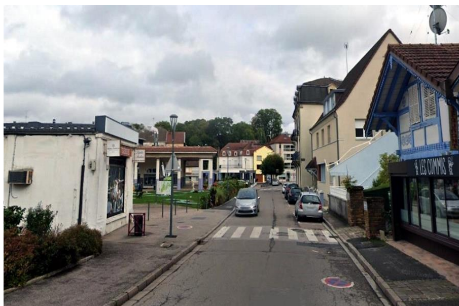
Rue de la « Grande duchesse Wladimir aujourd'hui »