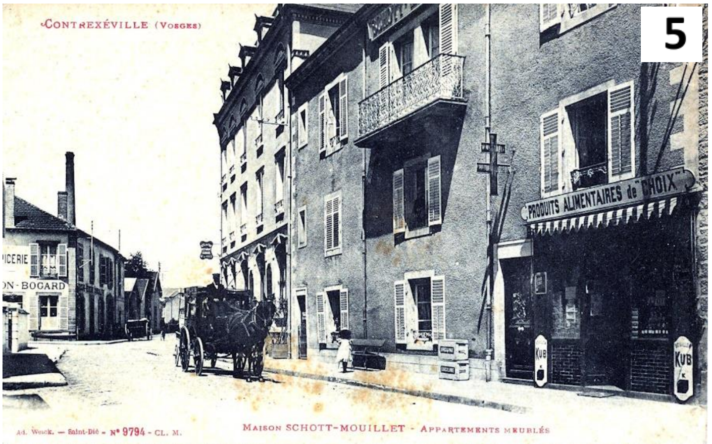
La Grande Rue de l'époque, rue du Shah de Perse aujourd'hui, avec en face au-dessus de l'épicerie Maison – Bogard la cheminée de l'usine d'électricité que l'on voit fumer sur la carte postale suivante.