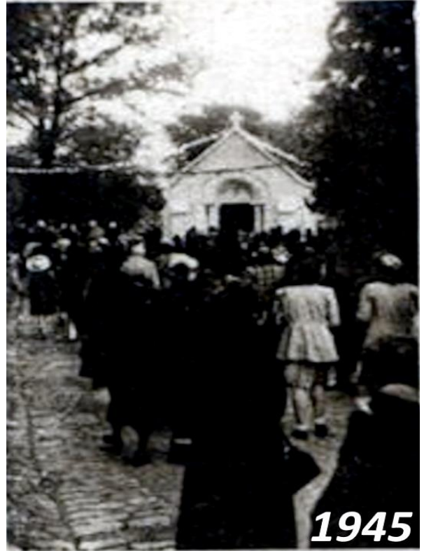
La montée de la foule vers la Chapelle