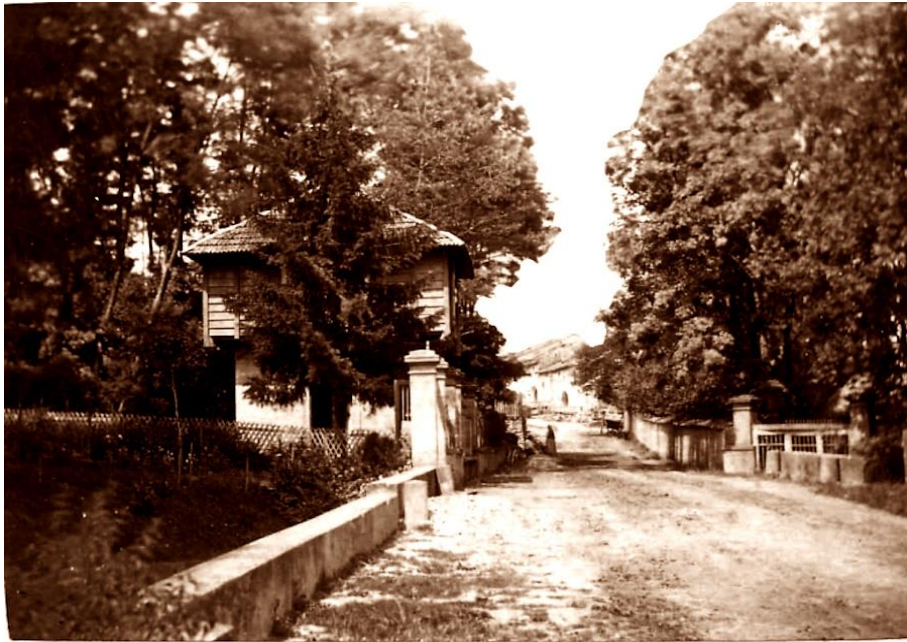
Le pont rouge avant 1880, à gauche la source du docteur Thiéry