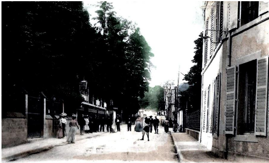
Contrexéville (Vosges) – Rue du Château