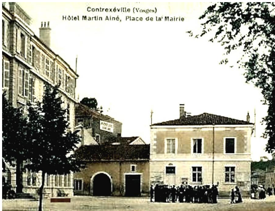
À gauche l'hôtel Martin Aîné qui sera l'Hôtel de Ville, ci-dessous la villa Bretagne qui remplace l'ancienne mairie.