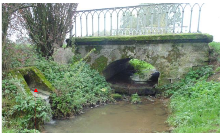
Ecoulement de la source n°4 en aval du pont