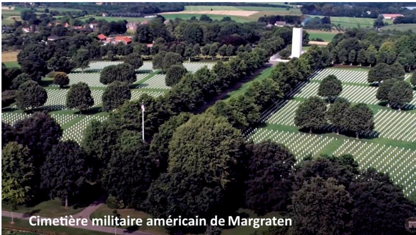
Cimetière militaire américain de Margraten