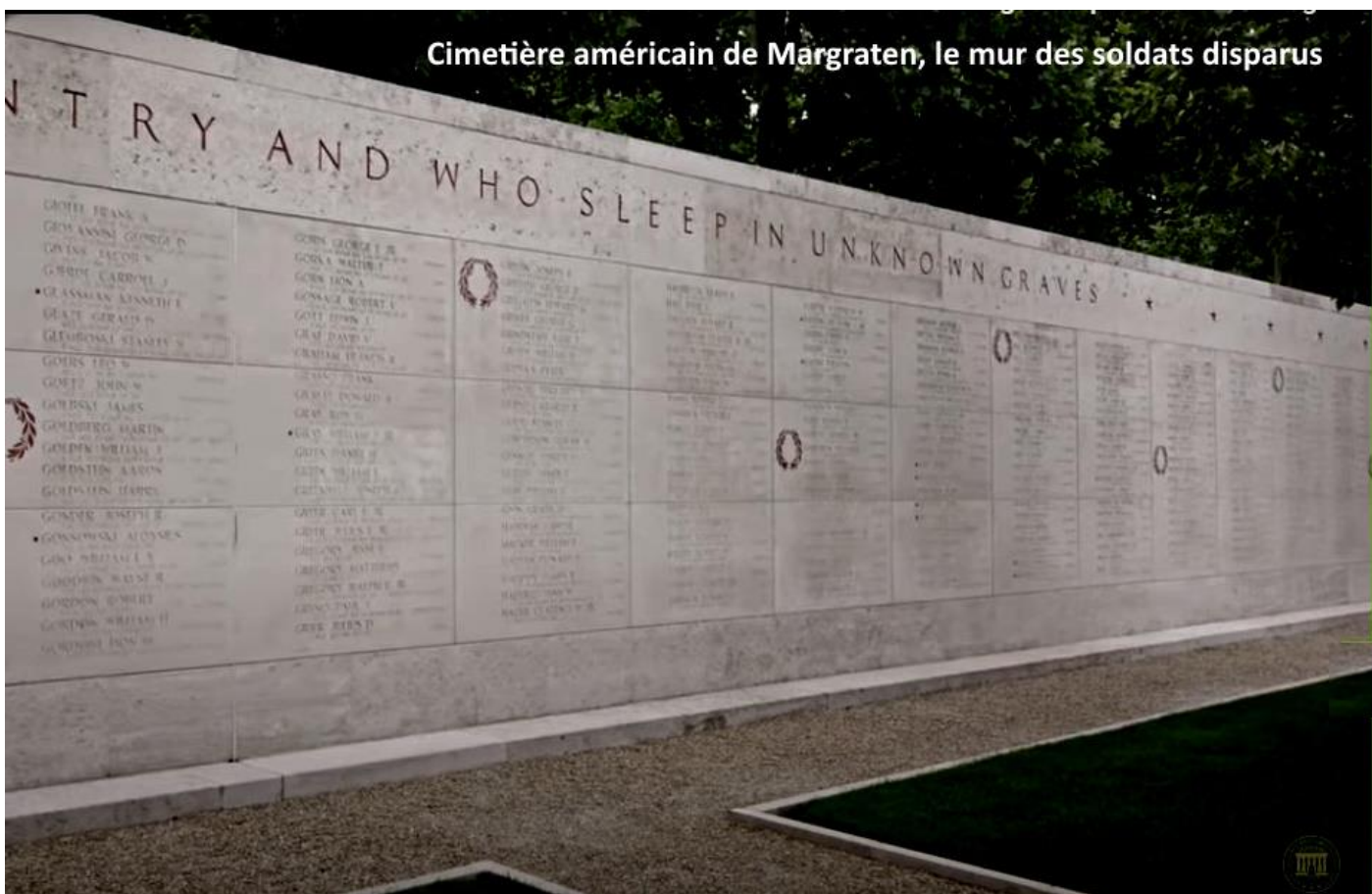
Cimetière américain de Margraten, le mur des soldats disparus