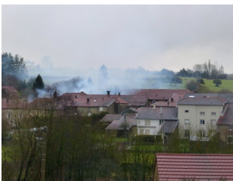
La fumée au dessus du village