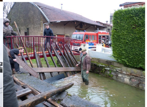
Des habitants dévoués en action