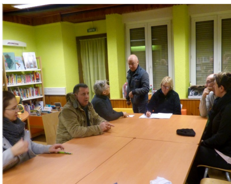
Conseil municipal d'urgence