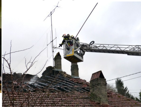
Sapeurs pompiers en action